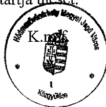
Dr. Márki-Zay Péter polgármester

Dr. Márki-Zay Péter polgármester úr: Ezzel a mai, rendkívüli közgyűlés véget ért, köszönöm mindenkinek a részvételt. Szeretettel várjuk Önöket a mai rendkívüli díszülésen, ahol a Magyar-Francia Baráti Társaság tartja ülését.